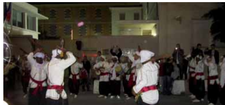
Un momento de la inauguración de la segunda parte del seminario Oportunidades de cooperación económica y empresarial entre Argelia y España , que se celebró el 12 y el 13 de diciembre en Orán y el que participaron un centenar de empresas españolas. A la derecha: Las autoridades y empresarios españoles pudieron conocer el folclore argelino de la mano del alcalde de Orán, Hassam Mohamed Zine-Eddine.